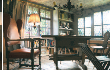
Meiningen, 2009 Rosswechselstation von ca. 1683